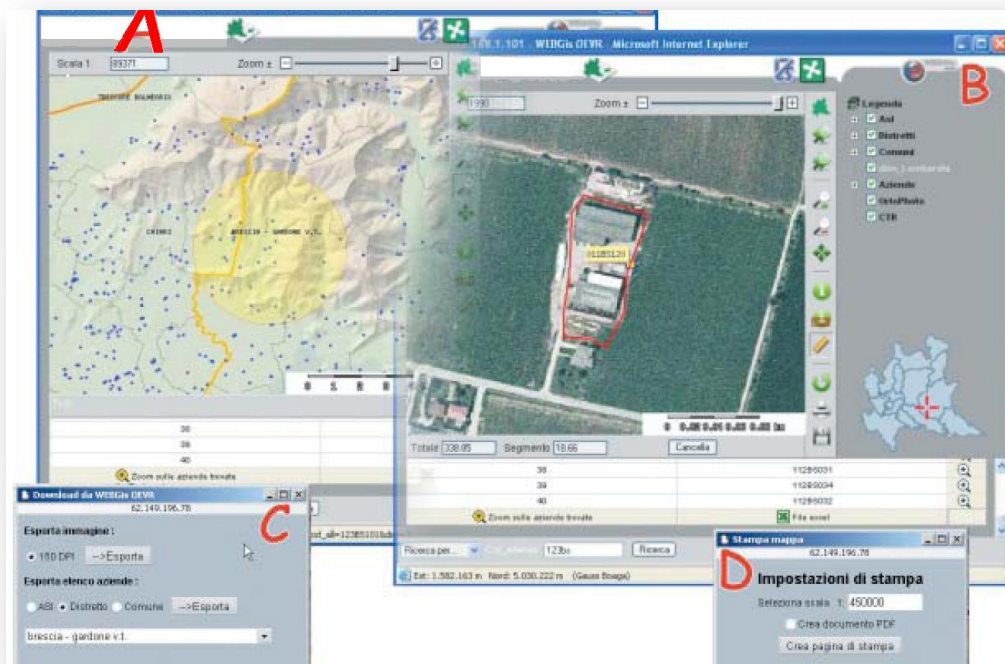
Figura 5 - Funzioni di analisi ed esportazione dei dati previsti

Se l'operatore riscontra anomalie nella posizione dell'azienda oppure nei dati anagrafici può segnalarle attraverso un'opportuna maschera. È in fase di progettazione la definizione di specifiche funzioni che permetteranno all'operatore di intervenire direttamente sui dati, modificando la georeferenziazione oppure l'anagrafica dell'azienda. Lo strumento Web G.I.S. permette di identificare l'azienda ove è presente un focolaio e tracciare i confini (buffer) delle aree di protezione e di sorveglianza (Figura 5-A), ottenere automaticamente l'estrazione di tutte le aziende zootecniche ricadenti in tali ambiti territoriali e salvarne l'elenco in un foglio Excel.