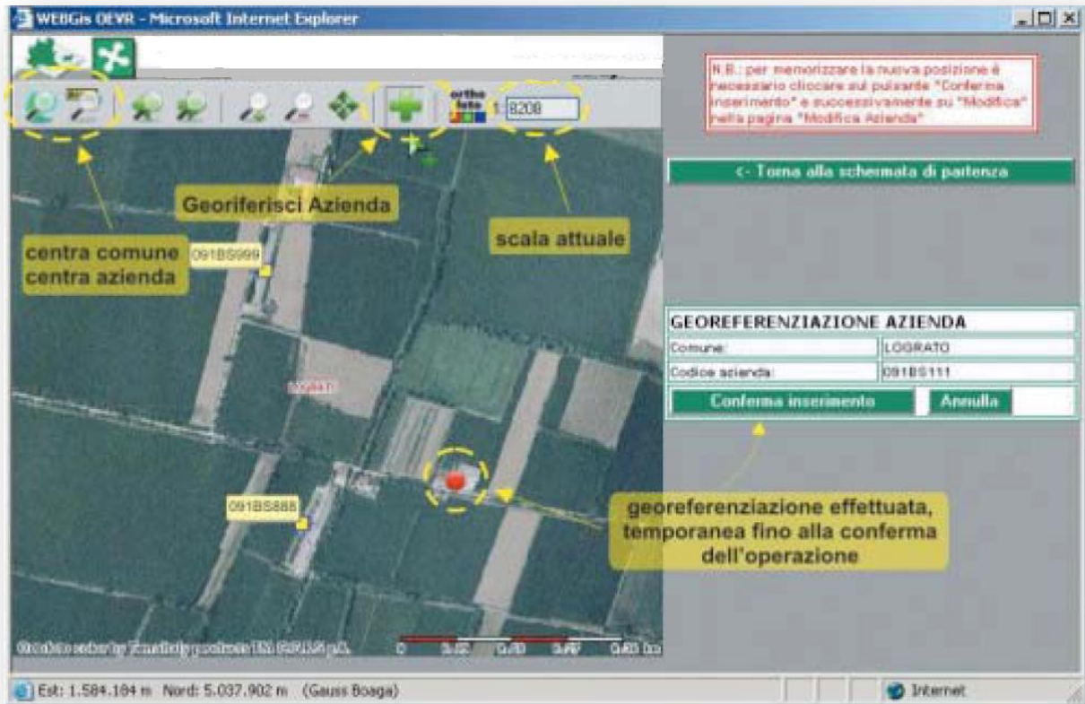
Figura 3 - Posizionamento e georeferenziazione di una nuova Azienda

L'applicativo web di georeferenziazione si caratterizza per l'essenzialità della schermata operativa, sulla quale sono predisposti pochi ed intuitivi strumenti, che riguardano le fasi di navigazione, la gestione dei supporti cartografici e chiaramente la georeferenziazione puntuale delle aziende (Figura 2).